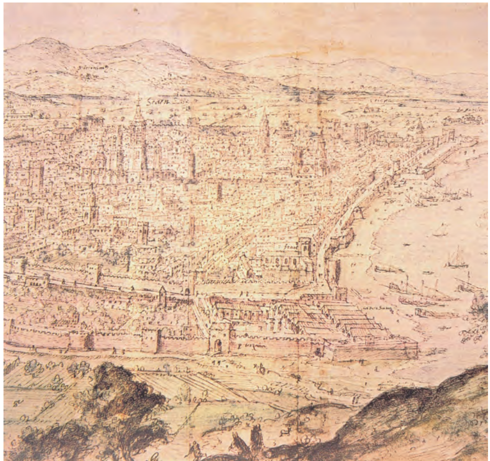
FIGURA 1. Façana marítima medieval de Barcelona: quaters de Framenors i del Mar. Plànol del s. XVI conservat a l'Arxiu d'Història de la Ciutat de Barcelona, publicat a J. SOBREQÜÉS (dir.), Història de Barcelona , vol. 3, La ciutat consolidada (segles XIV-XV) , Barcelona, Ajuntament de Barcelona i Enciclopèdia Catalana, 1992, p. 215.