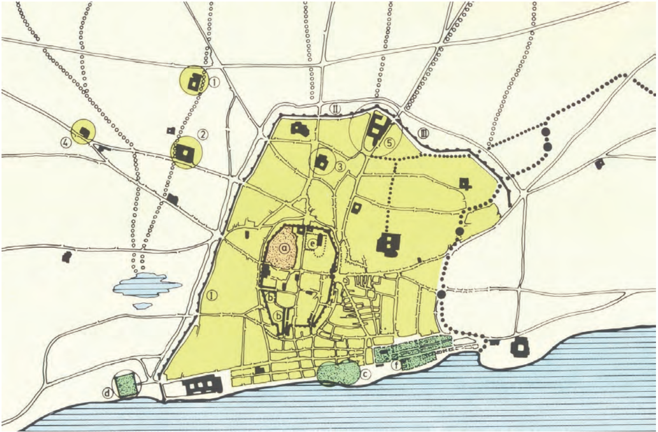
FIGURA 2. Plànol de Barcelona de la Baixa Edat Mitjana, elaborat per M. Guàrdia i A. Garcia Espuche, publicat a J. SOBREQÜÉS (dir.), Història de Barcelona , vol. 3, La ciutat consolidada (segles XIV-XV) , Barcelona, Ajuntament de Barcelona i Enciclopèdia Catalana, 1992, p. 44.